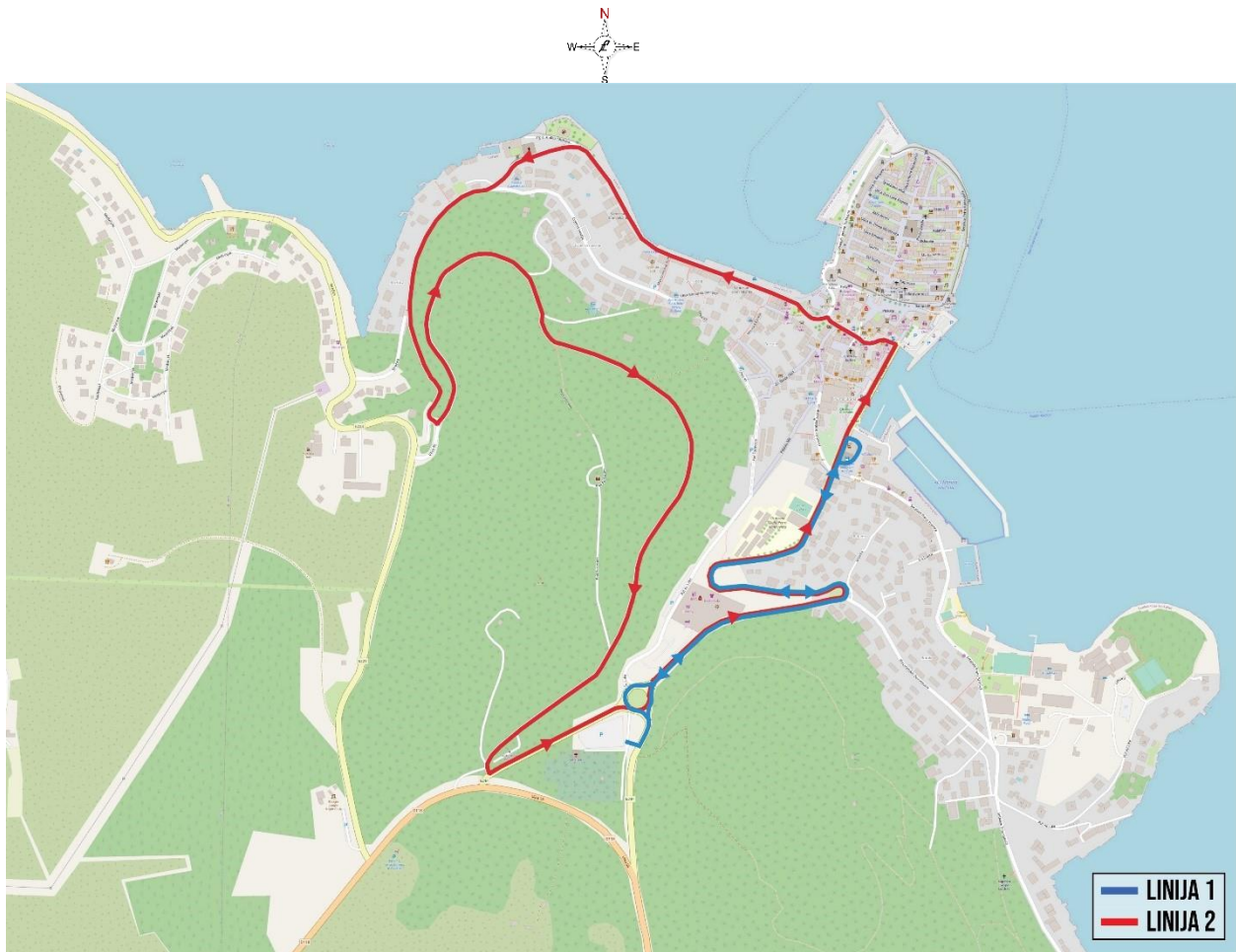
Slika 2. Linije javnog prijevoza – Park&Ride sustav