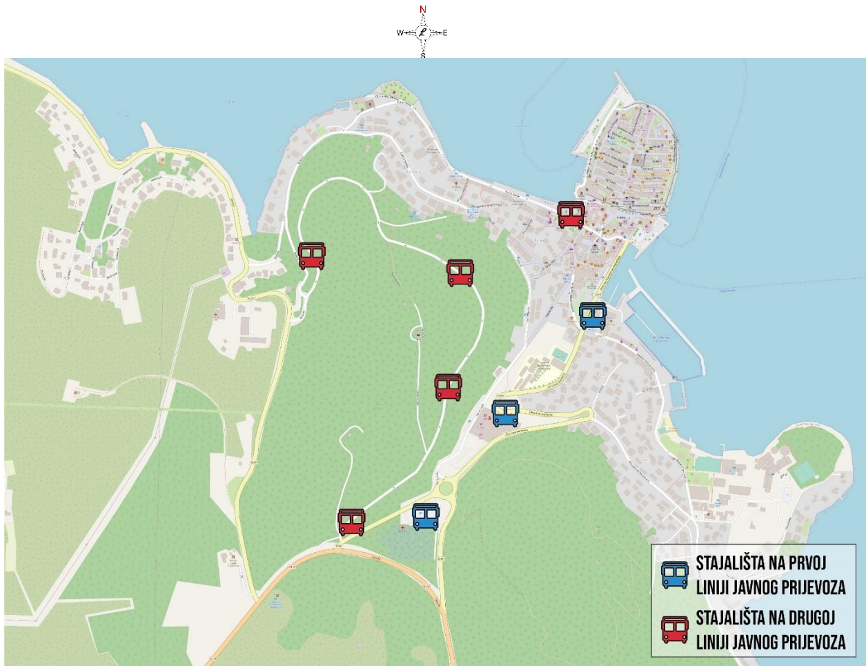
Slika 3. Stajališta javnog prijevoza