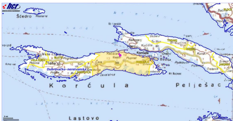
Slika 1. Pregled minski sumnjivih područja, https://misportal.hcr.hr/HCRweb/faces/simple/Map.jspx

Na području Grada Korčule nema minski sumnjivih područja.