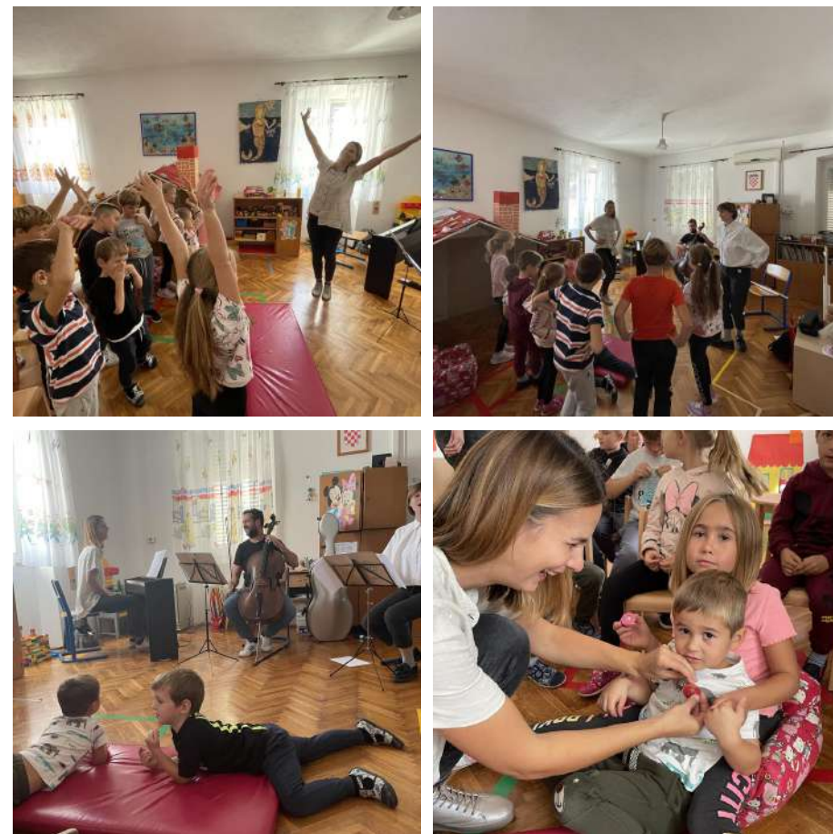
(Otočki) Ruksak (pun) kulture u vrtiću u Račišću, 2022.

Zgrada i djelatnici osigurani su u Euroherc osiguranju, a djecu je osiguralo Jadransko osiguranje.