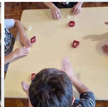
Dani kruha, 2022.