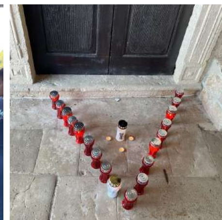
Dan sjećanja na žrtve Vukovara i Škabrnje, 2022.