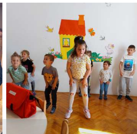
Svakodnevne aktivnosti u našem vrtiću