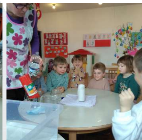
Tjedan zdravlja i Tjedan vode, 2022.