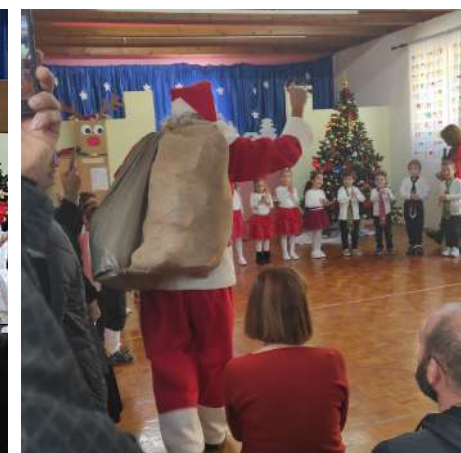
Božićna priredba, 2022.