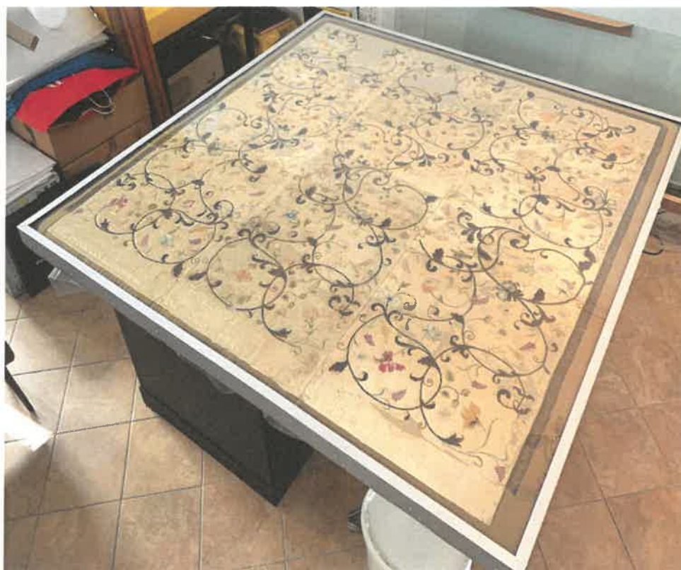
Plajt iz obitelji Arneri – Hektorović nakon završene 3. faze konzervatorsko – restauratorskih radova u ateliru Boschi