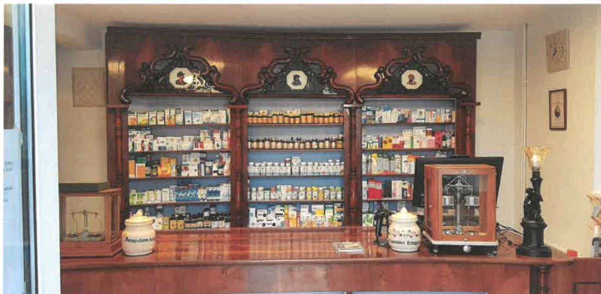
Namještaj korčulanske ljekarne iz 19 stoljeća, zaštićeno kulturno dobro RH u upotrebi nakon konzervatorsko restauratorskih radova